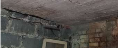
POMIESZCZENIE 2 - tam jest widoczne ugięcie stropu, strop został podparty belkami drewnianymi.